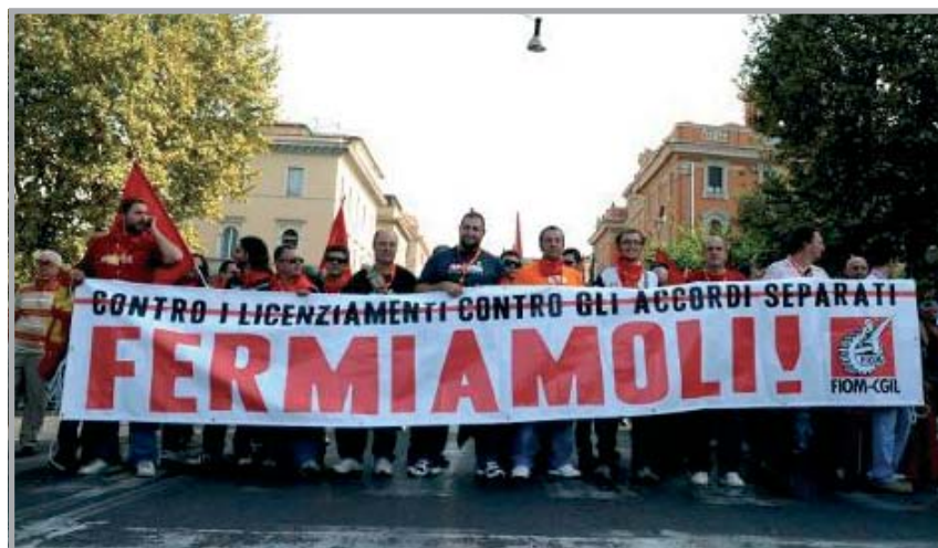
Roma, 9 ottobre 2009. Manifestazione della FIOM CGIL

Questo accordo interconfederale è chiaramente figlio dell'intesa sul nuovo modello contrattuale siglata il 22 gennaio scorso da governo e parti sociali ad eccezione della sola cgil. se questa risulta essere il risultato della modifica al sistema contrattuale, non possiamo che ribadire la nostra totale contrarietà: riteniamo vergognoso l'aumento salariale previsto, insufficiente l'una tantum ed inadeguato il voler sostituire, anche solo parzialmente, funzioni costituzionalmente affidate allo stato ed alle regioni, ad enti bilaterali che sono di natura privata.